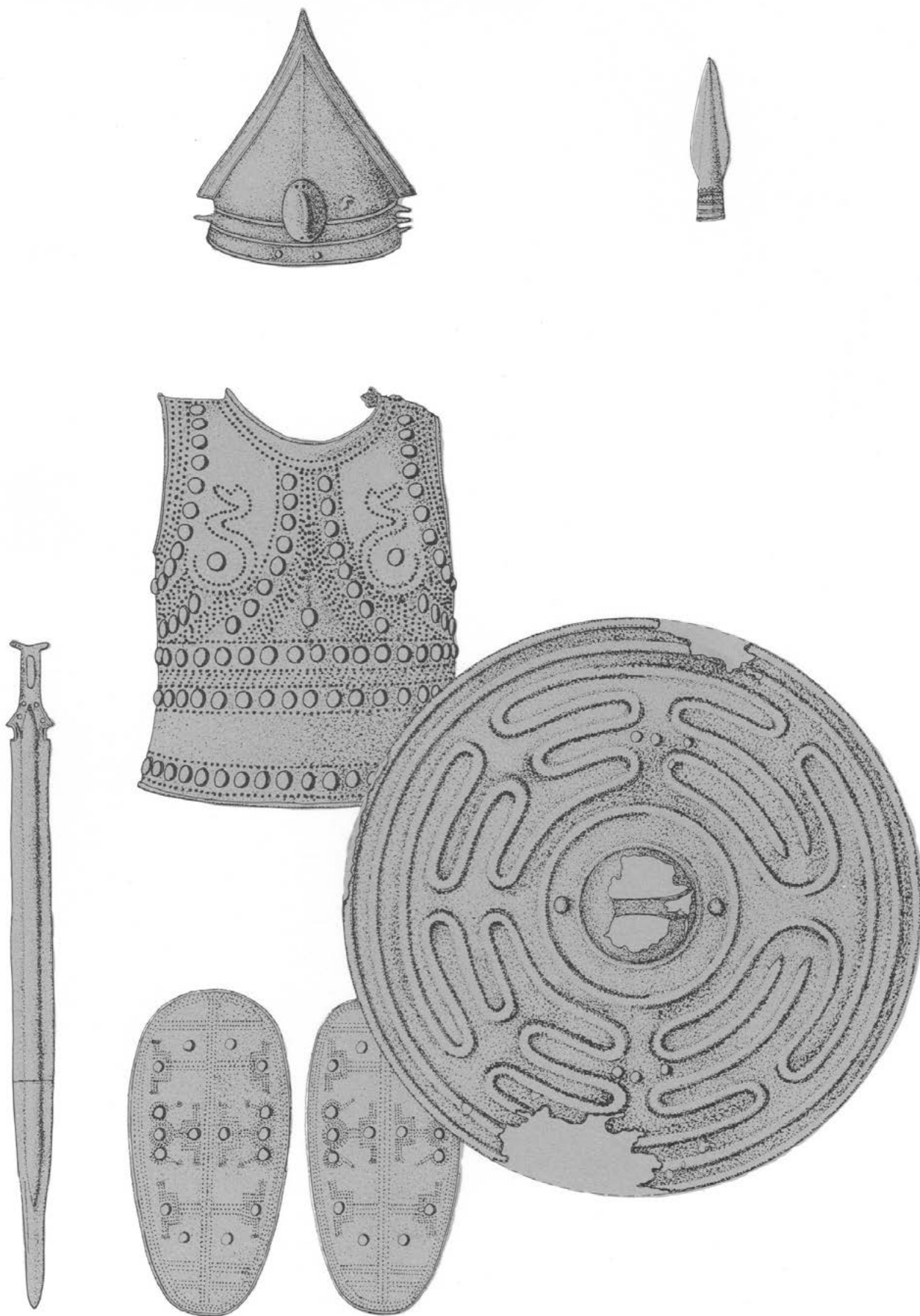
Fig. 2.3. Combinaison d'armes du Ha B en Europe occidentale selon P. Schauer (1975, pl. 12). Sont associés ici un casque normand (Bernières d'Ailly, Calvados), un bouclier britannique (Coveney, Angleterre), une cuirasse alpine (Fillinges, Haute-Savoie), une épée du musée de Nantes (Loire-Atlantique), des cnémides italiques (Pergine, Trentin-Haut-Adige) et finalement une pointe de lance britannique (Chingford, Angleterre).