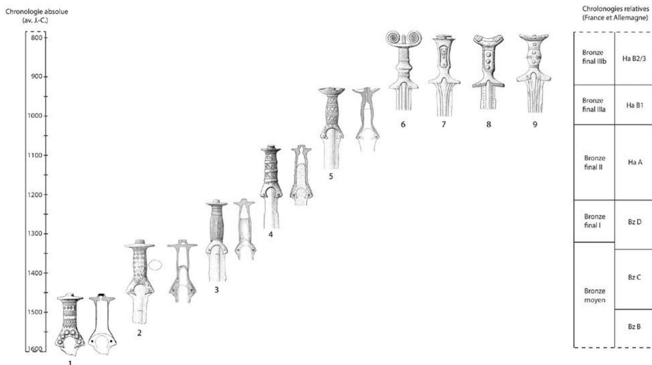
Fig. 2.2. Synthèse de l'évolution morphologique des épées à poignée métallique en Europe nord-alpine. 1. Spatzenhäuser (Allemagne, Bavière ; Quillfeldt 1995, pl. 1, 2 et Hundt 1965, pl. 1). 2. Schrobenhausen (Allemagne, Bavière ; Quillfeldt 1995 pl. 18, 54 et Ankner 1977 p. 331). 3. Augsburg (Allemagne, Bavière ; Quillfeldt 1995 pl. 34, 100 et Ankner 1977 p. 391). 4. Brüel (Allemagne, Mecklenburg-Vorpommern ; Wüstemann 2004 pl. 62, 432). 5. Nußdorf am Inn (Allemagne, Bavière ; Quillfeldt 1995 pl. 68, 202 et Hundt 1965 pl. 9). 6. Mannheim (Allemagne, Bade-Wurtemberg ; Quillfeldt 1995 pl. 74, 216). 7. Preinersdorf (Allemagne, Bavière ; Quillfeldt 1995 pl. 81, 235). 8. Svárov-Rymaň (République tchèque ; Winiker 2015, pl. 20, 52). 9. Dommelstadt (Allemagne, Bavière ; Quillfeldt 1995 pl. 96, 272 et Hundt 1965 pl. 14).

pas deux poignées exactement similaires portant le même décor. Une situation semblable existe au même moment en Scandinavie (Ottensmeyer 1969 ; Bunnefeldt 2016). Les artisans produisent ainsi des épées pour des utilisateurs qui s'inscrivent dans un groupe de personnes partageant une notion commune du concept d'épée et qui semblent affirmer leur individualité à travers des armes bien distinctes, notamment en ce qui concerne l'organisation des motifs ornementaux.