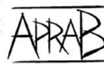
Fig. 2.5. Affiche du colloque «Âge de Bronze, âge de guerre ? Violence organisée et expressions de la force au IIe millénaire av. J.–C.» (Ajaccio, 14–17 octobre 2020), Dessin : F. Mathias © APRAB.